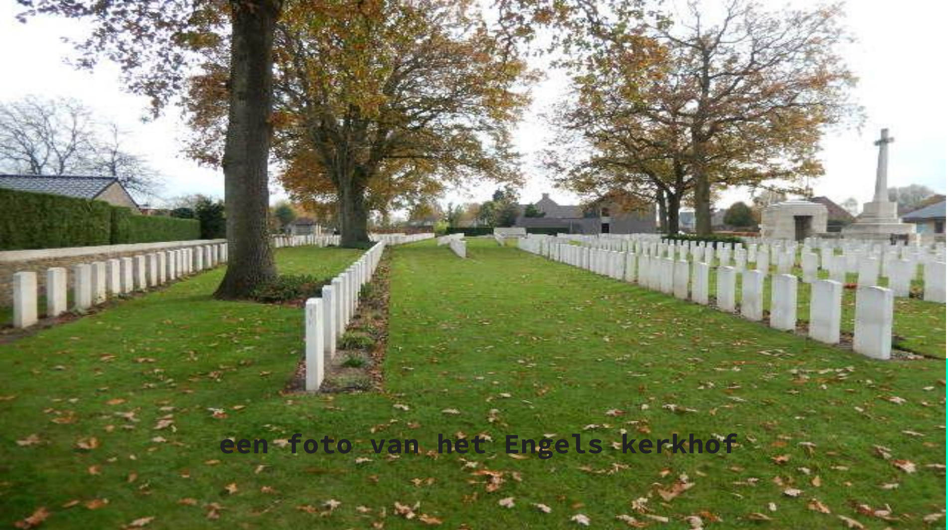
een foto van het Engels kerkhof