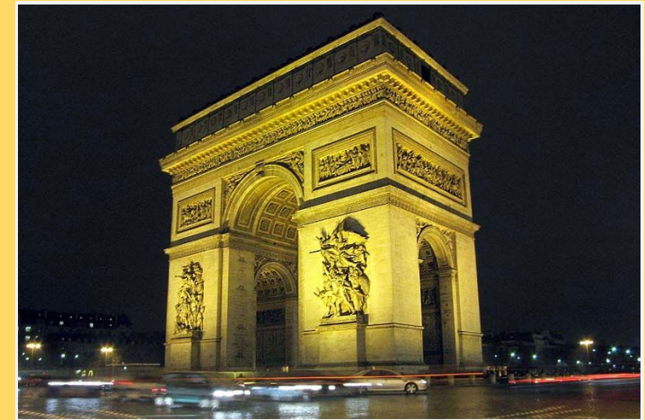
Arc de Triomphe in Parijs

Godsdienst: Rooms-Katholiek, Islam, Protestants & joods